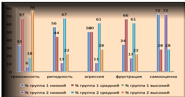
Рис. 2. Уровень эмоционального состояния подростков в полных семьях (группа 1) и в ситуации развод (группа 2), (методика Г.Ю. Айзенка, С.В. Ковалёва).

Результаты исследования дают основание сделать следующие выводы, что дети и подростки, в критической для них ситуации развода родителей, эмоционально значительно отличаются от своих сверстников, которых не коснулась данная стрессовая ситуация. При исследовании уровня тревожности детей 5-х классов, в полных семьях и в неполных семьях, по диагностической методике Дж. Тейлора, результат показывает: что дети из полных семей более спокойны. Уровень тревожности у 4 человек низкий, у 12 детей средний с тенденцией к низкому, и только у 2 средний уровень с тенденцией к высокому. Высокие показатели тревожности отсутствуют.