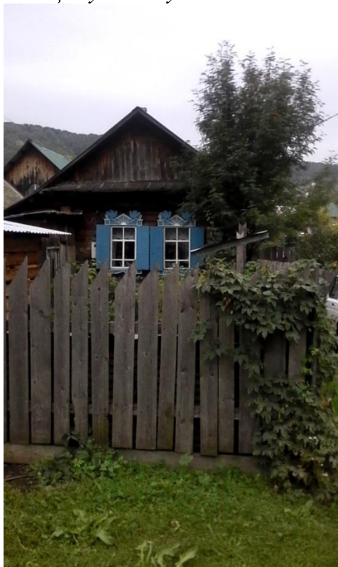
Рис.1 Наличники «Птицы и Солнце» ул. Улалушинская 78.

Следует отметить, что оформление деревянной резьбы уходит в прошлое. Крестьянское искусство несёт с собой декоративную мощь и красочное обаяние. Это вечные черты бытового искусства, данные коллективным творчеством народа, должны быть сохранены как достижение русского художественного труда [3]. «Когда соприкасаешься с прошлым, душа восторгается – от того, что всё это было. И горечь от того, что мы всего этого не знаем» [4]. В настоящее время наблюдаем, как дома предков сносят для постройки современных зданий, где нет места домовой резьбе, потому что стали модны пластиковые окна, а деревянные наличники, становясь архаизмом, идут на дрова.