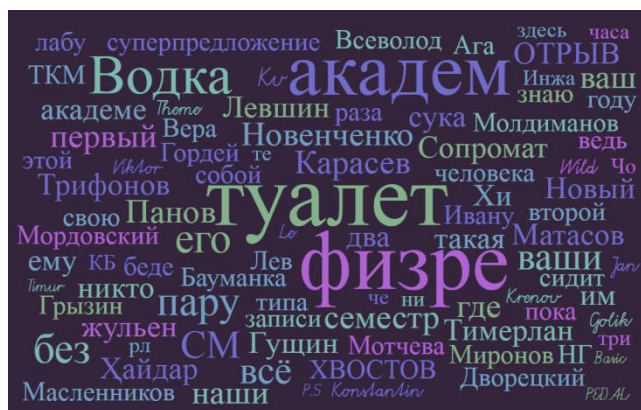
Рис. 3. Облако слов из комментариев студенческих групп Москвы ( ВКонтакте ), посвященных студенческим мемам (после фильтрации высокочастотных слов)

Сервисы и программное обеспечение, генерирующие облако слов, позволяют отсортировать по частотности, а затем визуализировать наиболее частотные слова из анализируемой коллекции текстов. Более крупный шрифт в облаке обозначает большую частотность слова относительно других слов в исследуемой коллекции текстов. Так, облако слов, извлечённых из обсуждений студенческих мемов среди сибирских пользователей ВКонтакте , показывает, что наиболее частыми контекстными словами, связанными с мемами, являются общага и общажитие . Не менее частотным является обценное слово бл*ть , а также тема, связанная с туалетами и прочими бытовыми условиями жизни студентов.