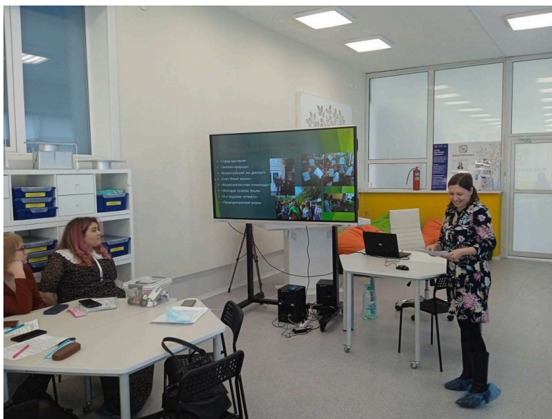
По завершению семинара обсудили аспекты сетевого взаимодействия и социального партнерства учреждений дополнительного образования детей с Педагогическим Кванториумом АГГПУ им. В.М. Шукшина.