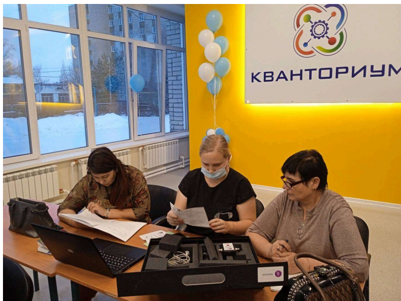
Преподавание осуществляют кандидаты наук АГГПУ им. В.М. Шукшина.