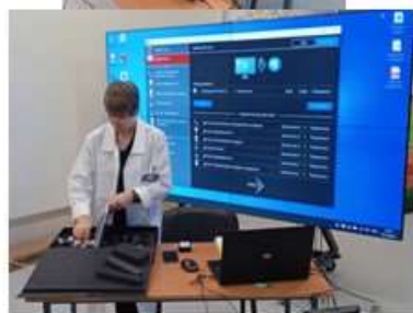
Курс повышения квалификации направлен на совершенствование профессиональных компетенций слушателей в области организации естественнонаучной исследовательской и проектной деятельности учащихся с использованием цифровых лабораторий.