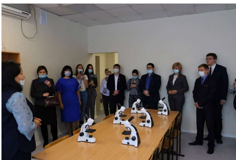
Сотрудники «Кванториума», преподаватели и студенты вуза продемонстрировали участникам мероприятия опыты с применением цифровых лабораторий по физике, химии, биологии.